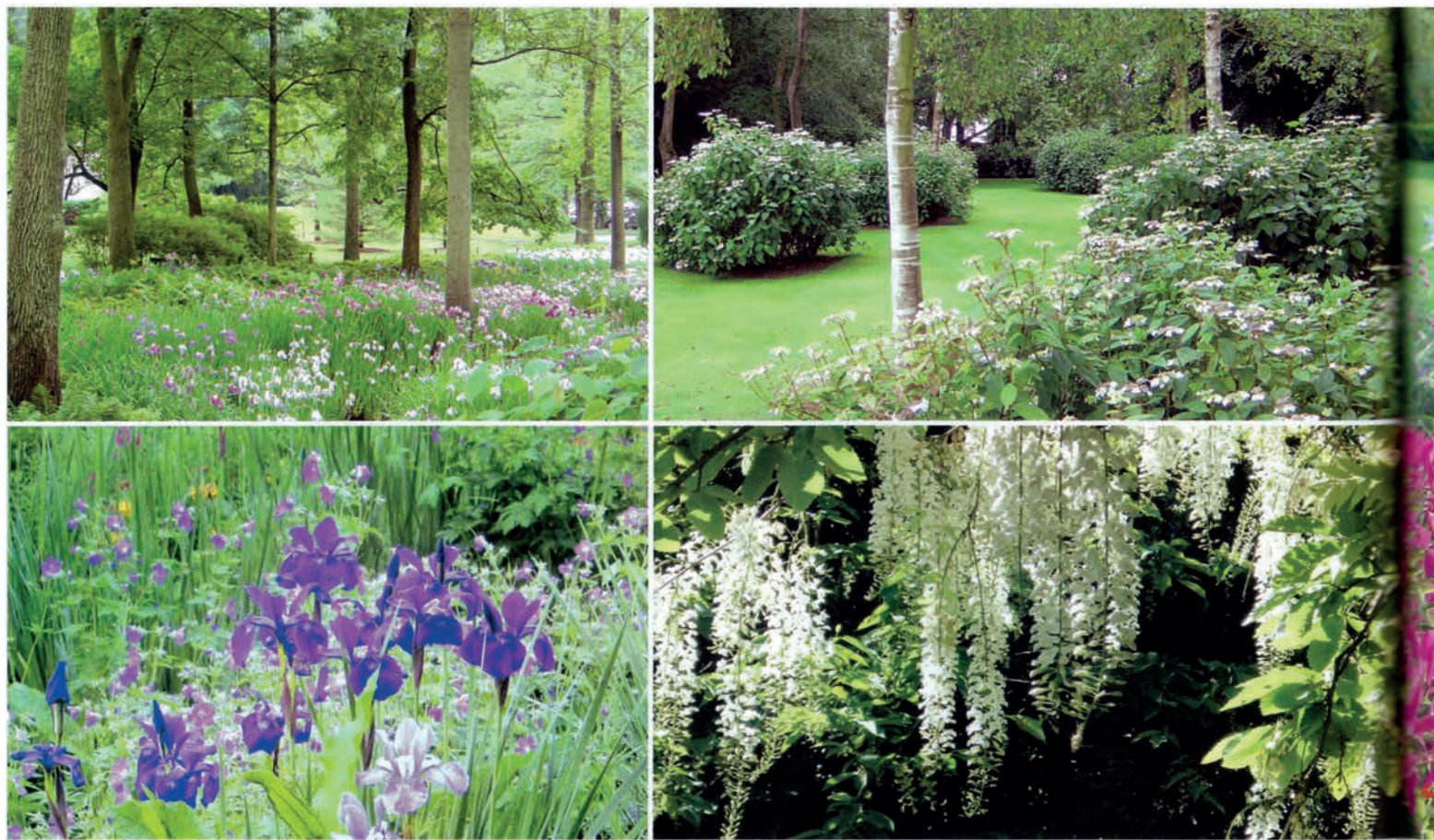
Illuminer les sous-bois d'iris ou d'hydrangeas, apporter la touche scintillante des glycines ( Wisteria longifolia 'Alba') pour enchanter le jardin.