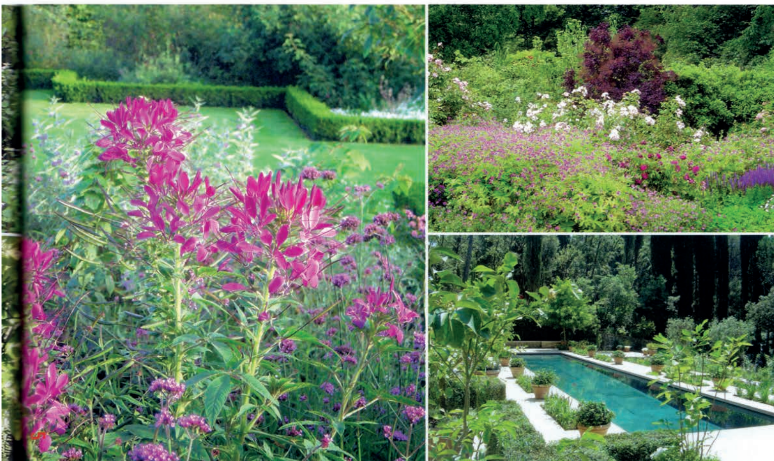
L'architecte paysagiste aime travailler les mixed-borders. En bas à droite, l'intérieur d'une piscine, réalisé en pierre bleue de Belgique, donne à l'eau une couleur d'un vert intense. Jardin privé. Italie

par le célèbre Capability Brown et réaménagé par la suite par les non moins célèbres Repton, Page et Jellicoe, il se réjouit. Rien à voir avec la création impatiente d'un nouveau jardin ni avec des borders à la Gertrude Jekyll ou à la Penelope Hobhouse. Ici, c'est le côté paysagiste « Beaux Arts » qui l'emporte. Pareil à Leeds Castle, dans le Kent, où il restaure le parc de 250 ha ravagé par la tempête de 1983. A Londres, il réaménage certains espaces publics, 14 squares et jardins datant de l'époque Victorienne.