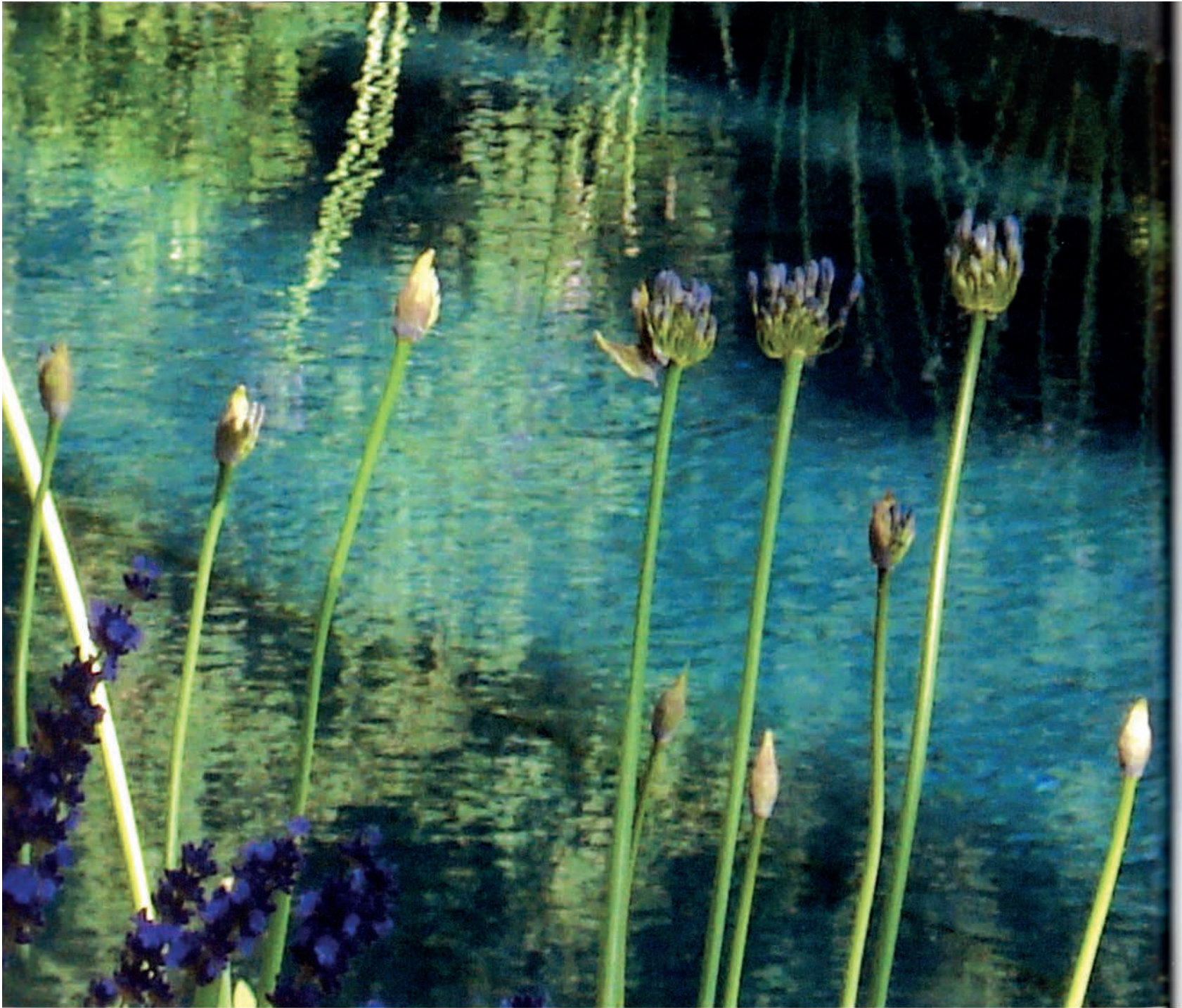
La passion des plantes est indissociable de l'art du jardin. Agapanthus 'Colombus' et 'Doctor Brouwer'. Jardin privé. Italie